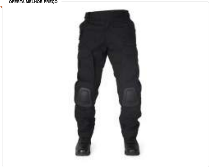
Calça Tatica Com Joelheira F3 Preta - Forhonor