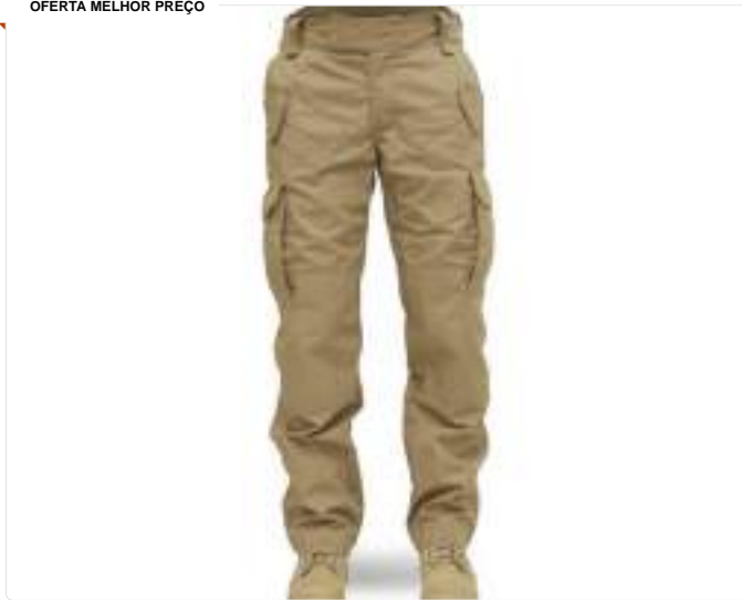
Calça Forhonor 911 Desert - Tatica, Militar, Airsoft, Ripstop