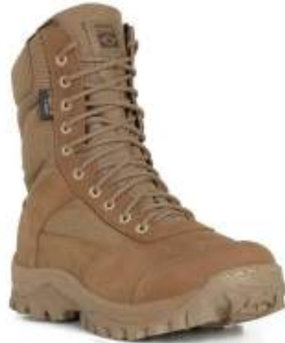
Bota Tática Airstep Lightness Confort 8627-35 Cordura/Couro Hidrofugado Coyote