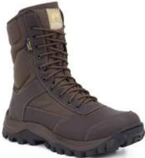
Bota Coturno Tático Easy Boot 8628-7 Marrom - Airstep